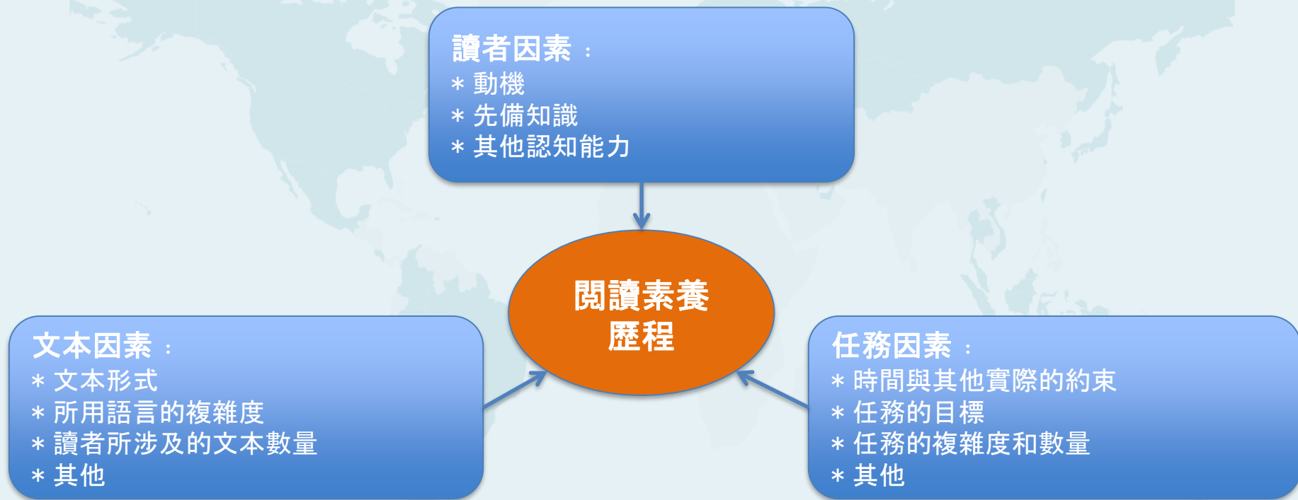
圖 1 : 閱讀素養評核概念模型